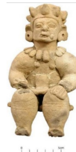
Figura 4 4

Finalmente, en el desarrollo de la sexualidad de los Tumaco, la institución de la familia fue sumamente importante, ya que entendieron el acto sexual con fines reproductivos. De igual forma, dentro de las representaciones en las cerámicas de su intimidad estuvo presente el placer tanto en la mujer como en el hombre (figura 5). El erotismo que estuvo inmerso en sus piezas era libre, distanciándose de lo que Bataille (1997) denominó erotismo de los cuerpos; puesto que, por medio de la afección recíproca, hay una preocupación por el otro, como en este caso, mientras el hombre tiene su falo por fuera, abraza a la mujer, dando cuenta del disfrute que existe en el acto sexual para ambos.