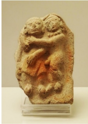
Figura 5 5

Lo anterior, demuestra que este tema no era tabú dentro de la cultura, debido a que no se prohibían ni se condenaban este tipo de cerámicas, de hecho, la sexualidad fue relevante dentro de su cosmovisión. Sin embargo, sí se puede inferir que existió un tabú con respecto a las cerámicas que escenificaban la homosexualidad, la representación de este tipo de cerámicas era casi nula.