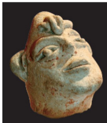
Figura 2 2

Asimismo, por medio del conocimiento de su cuerpo, denota que la comunidad Tumaco-La Tolita se permitió crear este tipo de transformaciones. No existía ‘tabuización’ alguna frente a su cuerpo. Lo que significa que no configuraron límites morales, y por el contrario, la exploración de éste les permitió plasmar esa esencia humanística en su arte. (Entiéndase esto no en un sentido conceptual renacentista o filosófico, sino como el arte del ser humano y su capacidad de pensarse e ilustrarse).