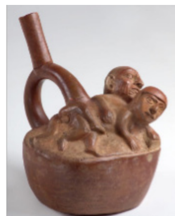
Figura 8 a

en la medida en que, los Moches se encargaron de representar actos sexuales entre sapos, ratones y llamas.