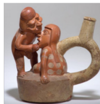
Figura 9 a