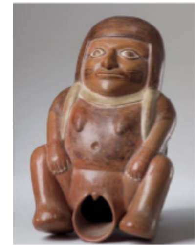
Figura 7 7

Continuando con la iconografía del cuerpo en los Moches, existen marcadas diferencias dentro de las cerámicas si se comparan con los Tumaco, la representación del cuerpo femenino no se ve marcado por las curvas o por un énfasis en la cintura, el cuerpo de la mujer Mochica es un cuerpo receptor, un cuerpo que espera ser fecundado. Las condiciones climáticas en las que vivían los Moches