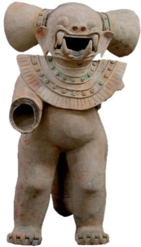
Figura 1 1

plenitud, desde el poder cósmico del Chamán-jaguar hasta los cuidados alimentarios de una madre que amamanta a sus hijos. (Villegas, et.al., p.7)