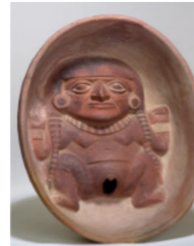
Figura 6 6

Es con relación a estas representaciones que podemos asumir que estas mujeres tuvieron una posición de enorme importancia y seguramente muy privilegiada. Estas mujeres, entonces, no habrían dependido de la mediación de un hombre para asumir su estatus social. Hasta donde podemos ver a través de las asociaciones funerarias, no fueron la hija, hermana, madre o esposa de alguien, sino que presumiblemente tuvieron una estrecha relación con el sistema ritual a través de su rol ritual como la Sacerdotisa. Es decir que no dependían de un varón para asumir el estatus que tenían, sino de su función en el sistema ritual. (Castillo & Rengifo, 2008, p. 28)